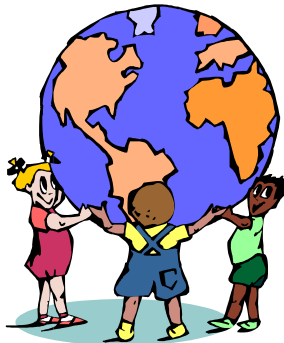
Kath. Kindergarten Christkönig