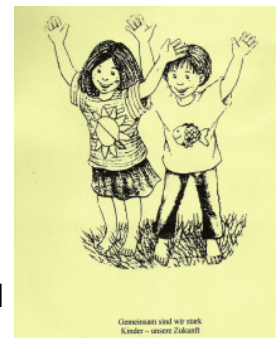
Kindergarten St. Franziskus