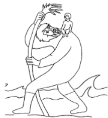
Kita St. Christophorus